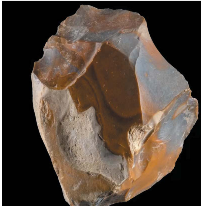
Másfél millió éves, kovakőből készült vágóeszköz

Ovadiát az 1960-as évek óta számos alkalommal kutatták a szakemberek, területén gazdag és ritka állatcsontokat, valamint kőszerszűket tártak fel.