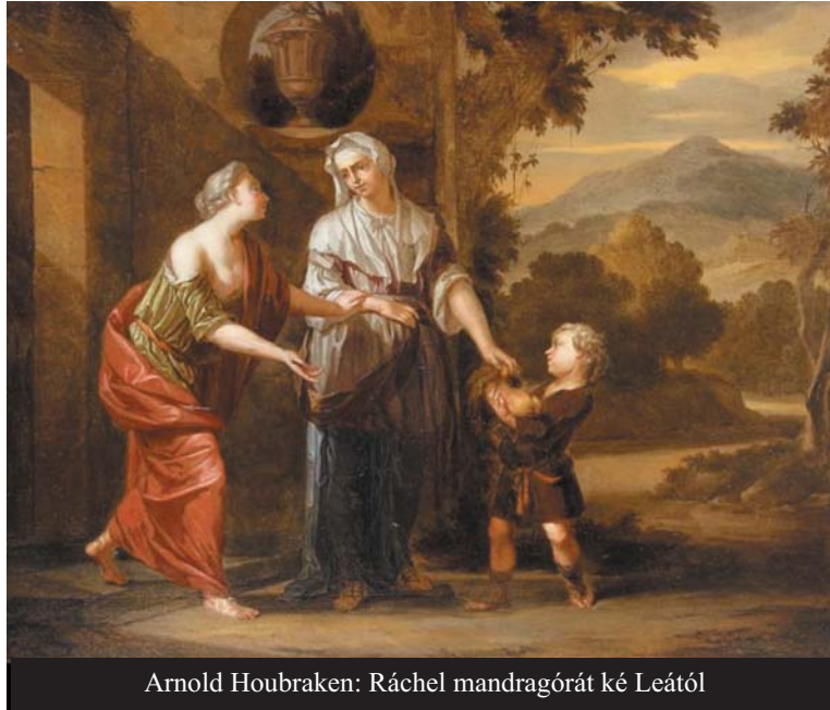
Arnold Houbraken: Ráchel mandragórát ké Leától

„Látta pedig az Ör.való, hogy Leát nem szereti és megnyitotta a méhét. És viselő lett Lea, fiút szült és elnevezte Reubennek.”