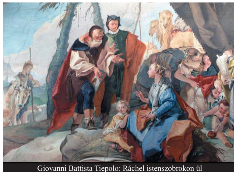
Giovanni Battista Tiepolo: Ráchel istenszobrokon ül

Lea fia talált egy mandragórát, (ami afrodiziákum, s emiatt) Ráhel szerette volna megkapni. Cserébe felajánlotta, hogy aznap este Lea töltheti Jákobbal az éjszakát. Jákob jól érezte magát Lea ágyában is, mert ebből az éjszakából ismét született egy fiú: Jisszakár. Később szült még egy fiút, Zebulont, és egy lányt, Dinát. Jákobnak így már tíz fia és egy lánya volt, de Ráhel még nem szült, ezért könnyögött az Ör.valónak, aki végre megnyitotta méhét, és ő is szült egy fiút: Józsefet.