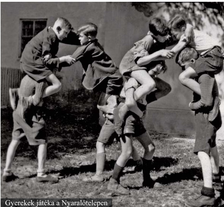
Gyerekek játéka a Nyaralótelepen

További részletek az Izraeli Kulturális Intézet Facebook oldalán.