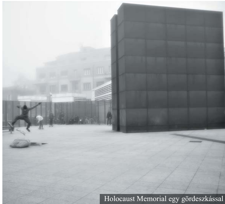
Holocaust Memorial egy gördeszkással

Az ellenreformáció idején azonban a zsidók is ellenségévé váltak a XVI. században. A zsidókat bezárták a város egy elkülönített részére, ez lett a Chuso degli Ebrei – ebből alakult ki később a gettó. S egyetlenegy zsinagóga működhetett tovább jellemző módon a via dell' Inferno (Pokol utca) egyik kis épületében. Aztán 1568-ben ki is tiltották teljesen a zsidókat a városból. S csak jó két évszázad elteltével térhettek