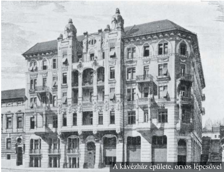
A kávéház épülete, orvos lépcsővel