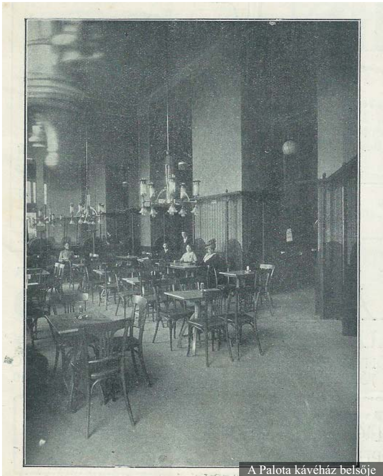
A Palota kávéház belsője

Bővebben, s még több fotóval itt olvashatják az eredeti cikket: https://tinyurl.hu/dS3i