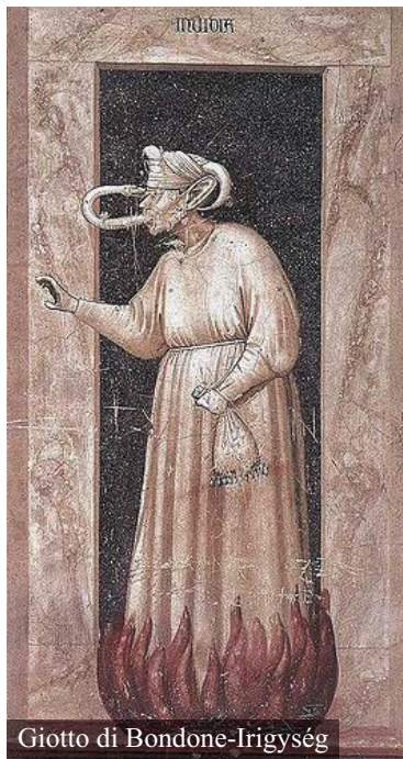
Giotto di Bondone-Irigység

A zsidó nép legfontosabb eseménye a Szinájnál történt kinyilatkozás. Ha mindez megtörtént, akkor az a zsidóság legitimitását adja. Midrás szerint a világ teremtésének célja is az, hogy a zsidók átvegyék a tízparancsolatot. Ha ez nem történik meg, a világ visszatér a sötétségbe. Na, most egy ilyen eseményt nem lehet szépen, csendben, halkán megtenni, ennek meg kellett adni a módját, I.tennek meg kellett jelennie a nép előtt, mint a – kivonulás utáni – győztesnek. A hangzavarnak, füstnek nem az ijesztés a lényege, hanem az, hogy ez is igazolja, mindent megtehet.