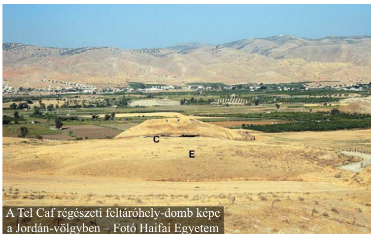
A Tel Caf régészeti feltáráshely-domb képe a Jordán-völgyben

Mikroszkóp alatt megvizsgálták a gabonamaradványokat, s a keményítő erjedési folyamatának jeleire leltek bennük, ami arra utal, hogy alkoholkészítésre használták azokat.