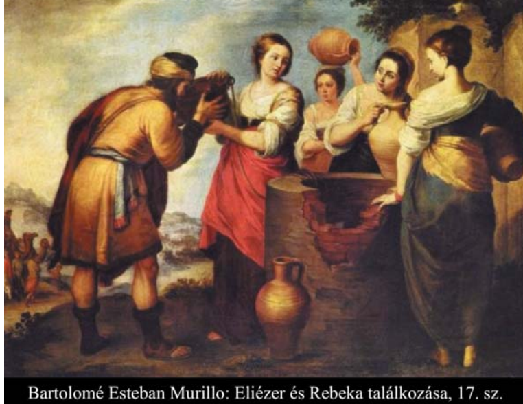
Bartolomé Esteban Murillo: Eliézer és Rebeka találkozója, 17. sz.

Terah állattenyésztéssel foglalkozott, ami kitűnő megélhetést biztosított az egész családnak. Hetvenegy éves, amikor a három felesége egyszerre szült fiúgyermeket számára. Elnevezte őket Ábrámnak (aki később Ábrahám lett), Náhórnak, és Háránnak. Miután a gyermekek kamaszkorba léptek munkára fogta őket, megtanított nekik mindent, amit az állattenyésztésről tudni kell. A fiúk felnőttek, Ábrám, és Hárán megházasodott. Háránnak született egy fia Lót, és egy lánya Milka. Egy tragédia árnyékolta be a boldog család életét: Hárán váratlanul meghalt. Az élet ment tovább, és mikor Milka felnőtt, a nagybátyja Náhór feleségül vette, és elkezdte szülni a gyermekeket, a család egyre nőtt. Terah olyan ügyesen