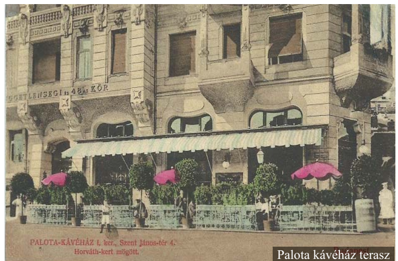
Palota kávéház terasz