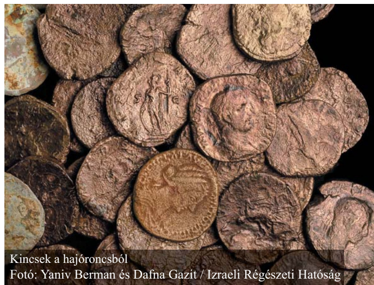
Kincsek a hajóroncsból

Az odavesztett utasok személyes tárgyai is előkerültek, többek között egy általában gyűrűben elhelyezett