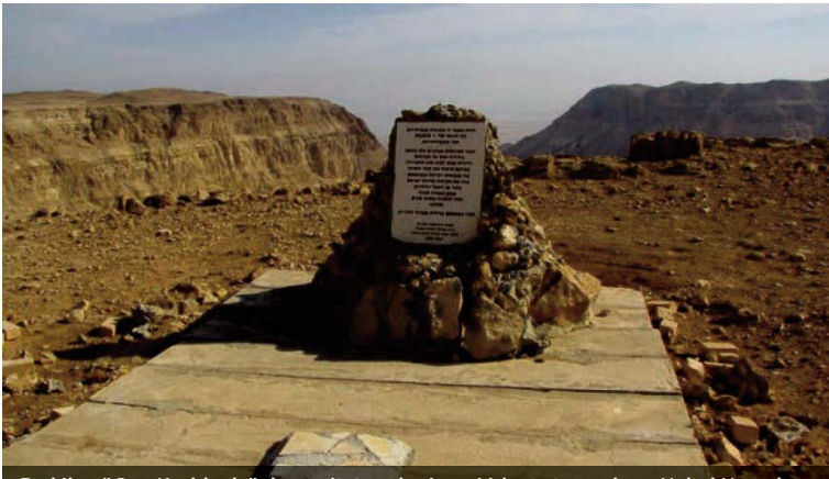
Emlékmű Bar-Kochba hős katonái tiszteletére a Júdeai-sivatagban, Nahal Heverben

Tórai parancs, hogy a Peszách másnapjától kezdődő ötven napot számláljuk. Hét teljes hetet, 49 napot kell számolnunk. Ez az oka, hogy minden este, a számlálásnál nemcsak a napokat, de a heteket is számoljuk, pl: ma van a hetedik nap, amely egyúttal egy hete is az ómernek.