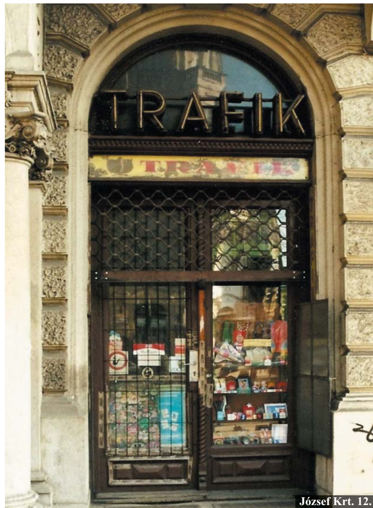
József Krt. 12.

lottam ilyen sikertörténeteket?!/ Azután néhány éve – politikai alapon... - megint jött egy módszerváltás, és az új „nemzeti” trafikengedély sok régi családi