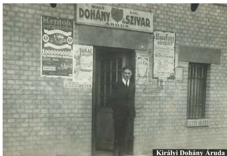
Királyi Dohány Áruháza

okmánybélyegek, majd a sorsjátékok forgalmazását is megengedték. A trafikos tehetőségétől és ügyességétől függően ezeken kívül még papír-írószereket, vagy kisebb ajándéktárgyakat is tarthatott az üzletében. Erről Szép Ernő Trafikról szóló tárcájában igen részletesen beszámol: