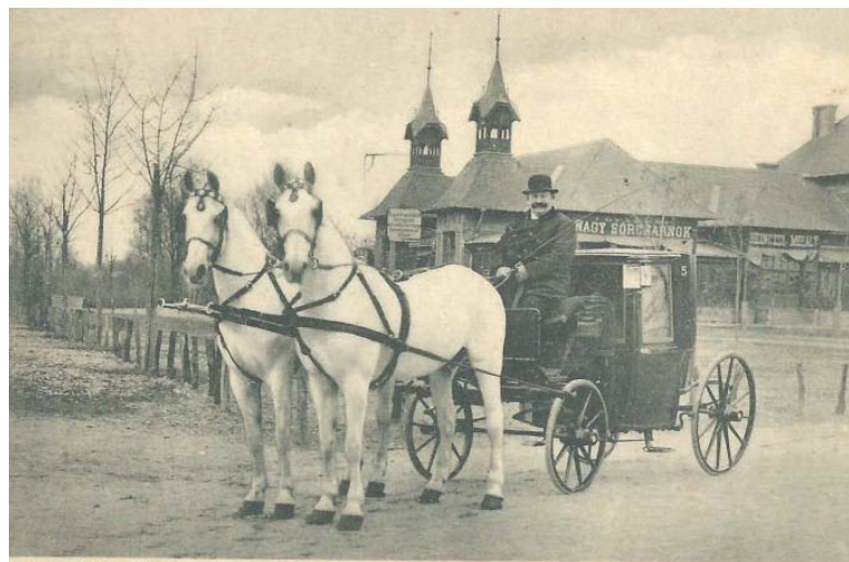
Göncz Antal, Budapest.

repi temető között, a mai ügető versenypálya egy részén épült (ma már az Aréna bevásárlóközpont van ott!). A pálya kerülete 750 méter, a futópálya szélessége 20 méter volt, mindkét oldalon a korláttal elkerítve. Az 1100 méter kerületű bécsi pályához viszonyítva kicsi, de ne feledjük, hogy ebben az időben, Franciaországban 600, sőt 400 méter kerületű ügető versenypályák is voltak. A közönség részére 1000 ülőhellyel bíró tribün épült „csinos svájci stílusban”. A pálya belső oldalán, egy emelkedett részen külön elkerített hely áll a tagok, futtatók és mások rendelkezésére. A tribün két oldalán volt az olcsóbb hely a közönség számára. A totalizátor pénztárat úgy helyezték el, hogy minden hely közönsége hozzáférhessen. A tribünre szóló jegy férfiaknak 4 Ft, nőknek 2 Ft, a pálya közepén lévő hely 50 krajcár, a két oldalán levő hely 20 krajcár volt.”