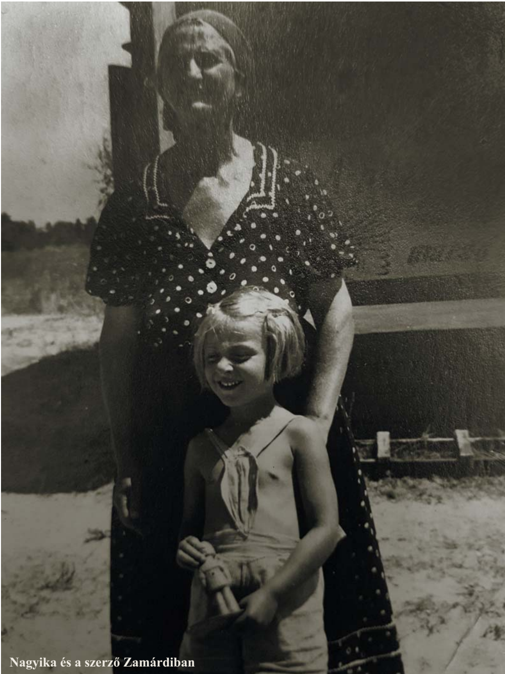
Nagyika és a szerző Zamárdiban

Nagy ember volt: a mindennapok egyik hőse.