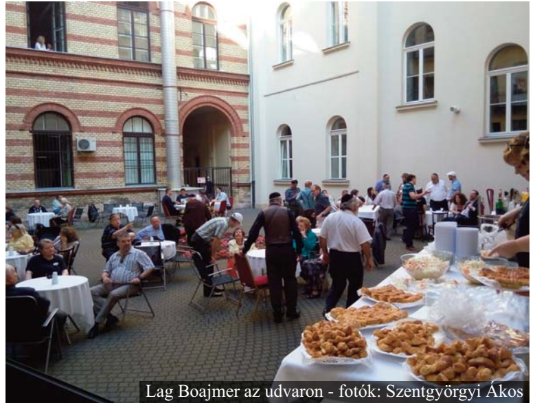
Lag Boajmer az udvaron