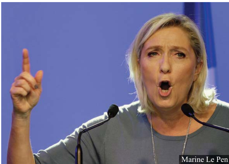
Marine Le Pen

Ahogy közeledik az első forduló dátuma, (április közepe), olvasom a legmértvadászabb orgánumban, a Le Monde-ban és a Le Figaróban, két világ, hogy Madame Le Pen szinte száguld előnyének a növelésében, nincs már túlságosan messze attól, hogy győztesnek vélheti magát. Szerencsére csak vélheti, de én magam, (fél évszázad alatt, gondolom, megismertem a franciákat, és a végső pillanatban eltántorodnak tőle. Mert léleken demokraták, bizonyították történelmükben, több