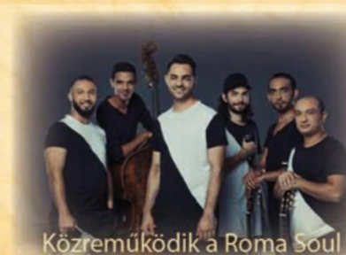
Közreműködik a Roma Soul

Színház- és Filmművészeti Egyetem Ódry Színpad 1088 Budapest, Vas u. 2/c