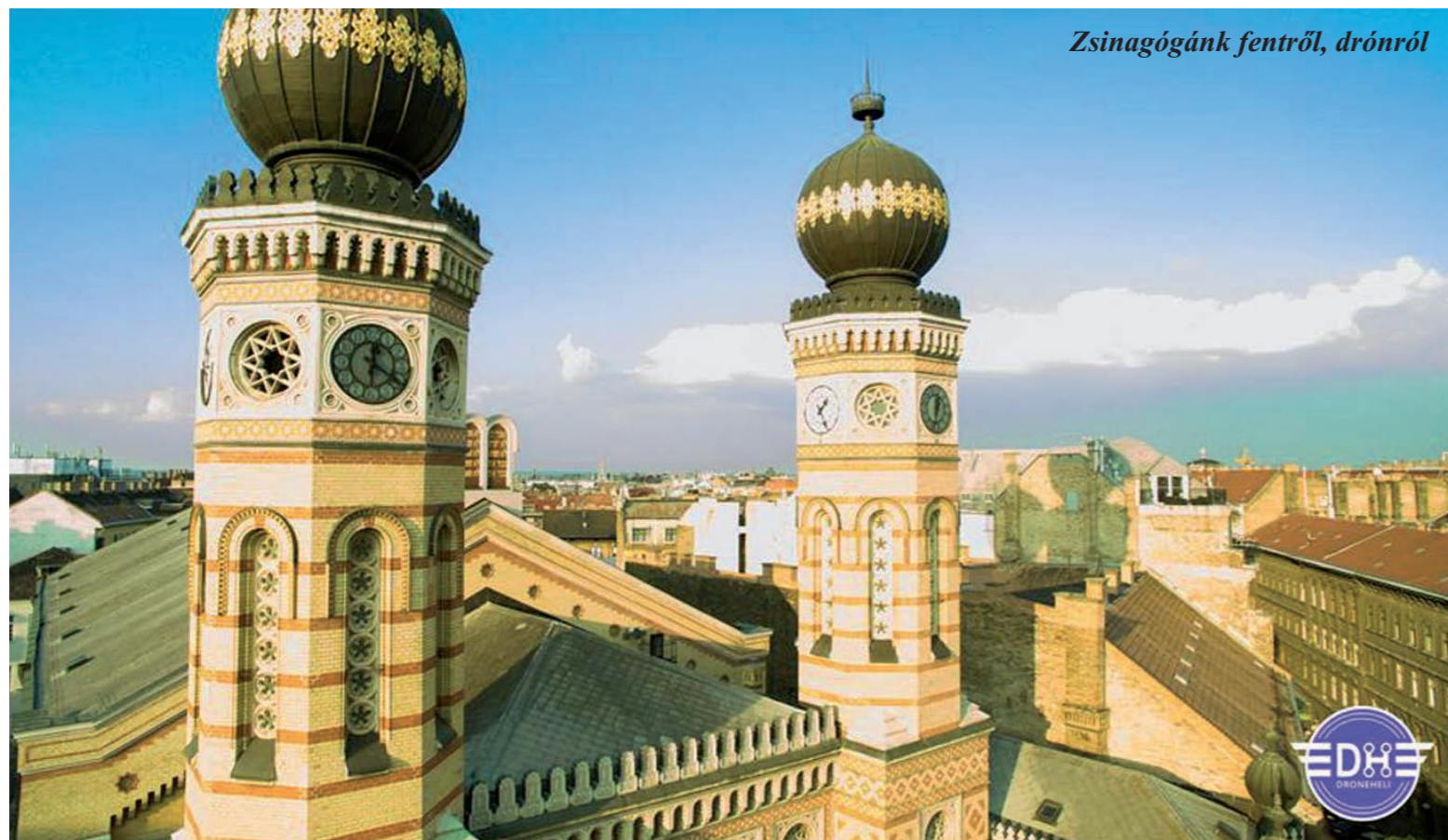
Zsinagógánk fentről, drónról

Egyrészt szomorú, másrészt viszont örömteli, hogy betelt mindkét tábla a Jahrzeit-falon. Szomorú, hiszen azt jelenti, sok-sok eltávozott szeretőnkre kell emlékezni. Örömteli, mert bizonyítja, hogy jó ötlet volt, illetve így sokan állíthattak emléket elhunyt hozzátartozóiknak. A körzet vezetése a jelentős igényt figyelembe véve úgy döntött, hamarosan egy újabb táblát állít a Dohány utcai zsinagógában.