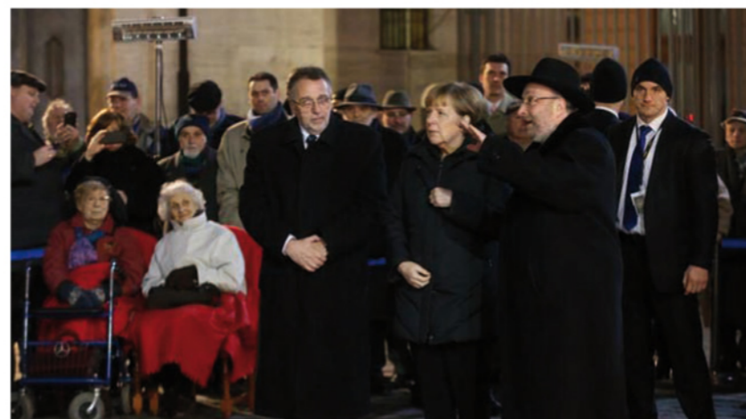
Angela Merkel a Dohányban