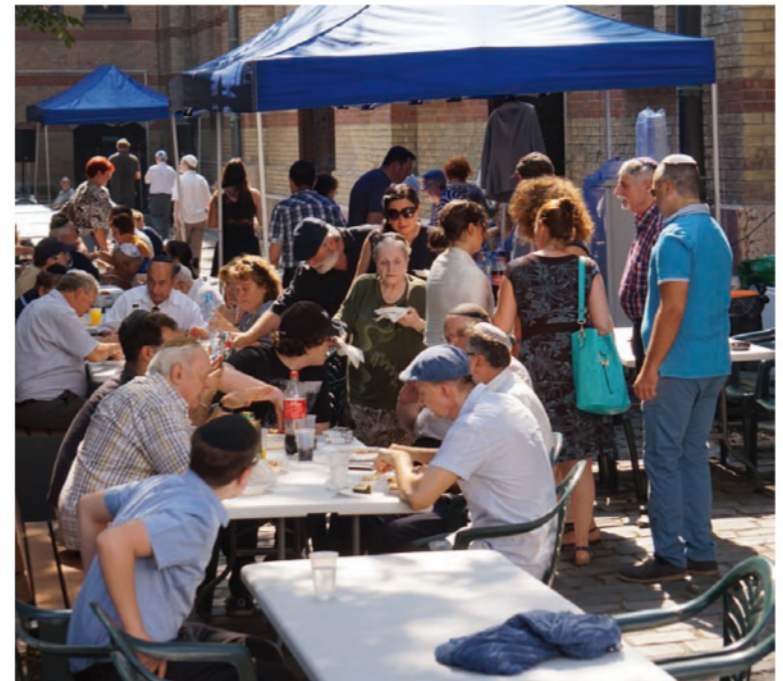
A körzet szokásos augusztusi, évzáró partija