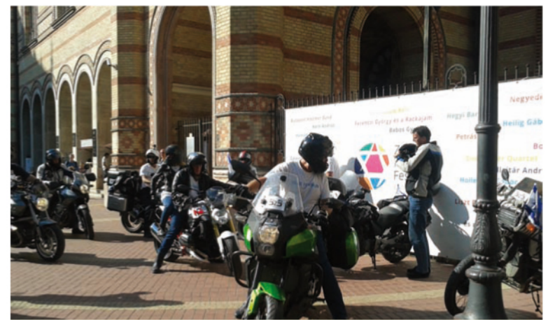
Zsinagógánkban is jártak a berlini Maccabi Európa Jákókra tartó motorosok