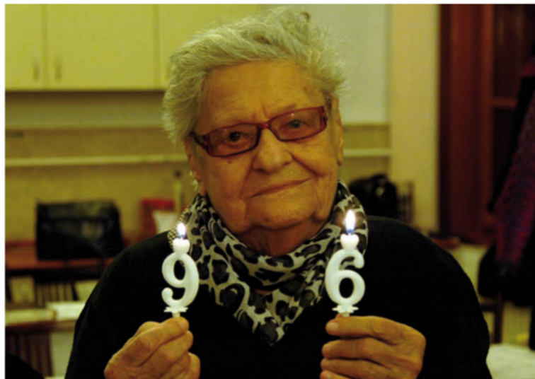
Joli néni 96