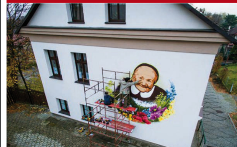
A lengyel ápolónő, Irena Sendler nagyjából 2500 zsidó gyereket csempészett ki a varsói gettóból, saját életét is kockára téve ezzel. Irena 2008-ban halt meg, 98 évesen. Cieszyn városában csodaszép ajándékkal adóznak Irena emlékének: egy hatalmas falfestmény készült a nő portréjából, virágkoszorúval körülveve.