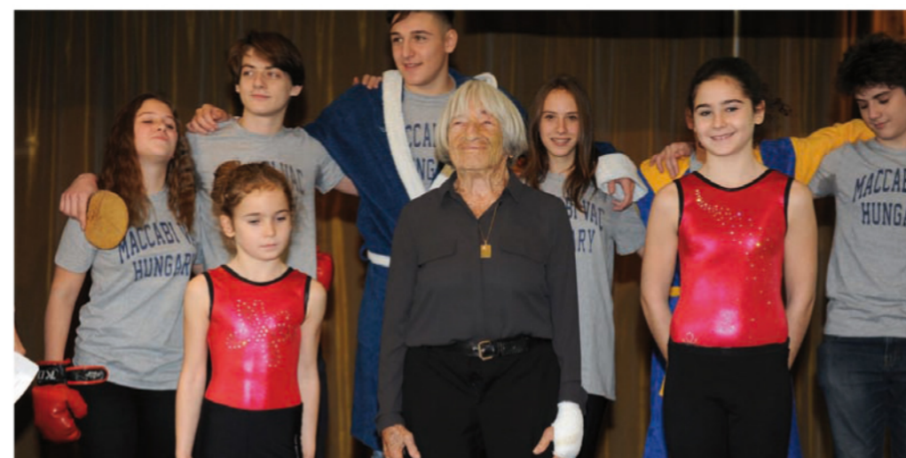
Keleti Ágnes és az ifjak

hogy a magyar kormány támogatja a Maccabi VAC pályázatát, s siker esetén 2,1 milliárd forintot biztosít a szervezésre és rendezésre.