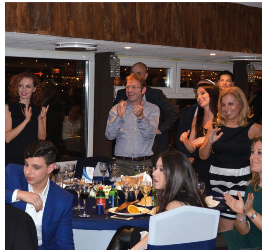
Remek a hangulat a hajón

Hazafelé indulva, még a szálloda folyosóján futottam Motti Tichauerbe, aki gratulált és egy hónappal korábbi beszélgetésünkre utalt (erről a Pesti Sólet előző számában olvashattak):